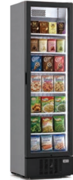
390 WOC VF