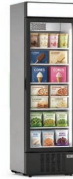
390 C VF