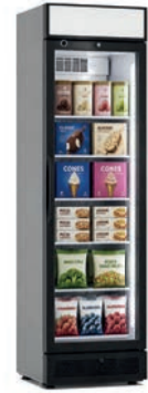
377 C VF